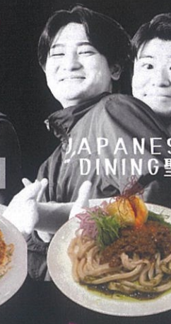
JAPANESE DINING 聖