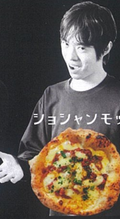
ショジャンモッカ