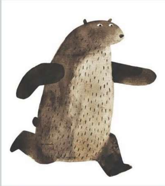
クレヨンハウス『どこいったん』より