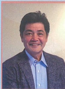
元ホークス監督 工藤 公康氏