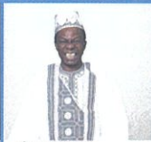
駐日ギニア 大使館顧問 オスマン・サンコン氏