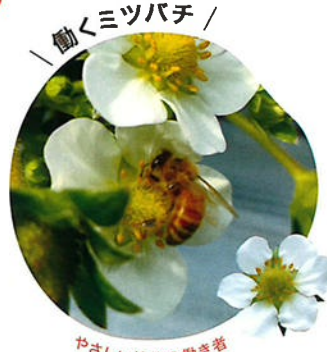
／ 働くミツバチ ／