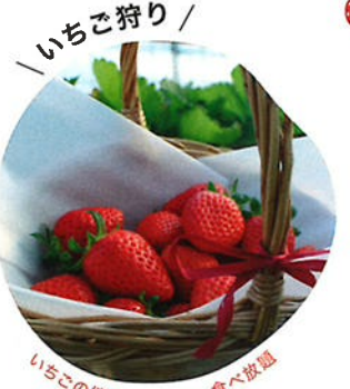
／ いちご狩り ／