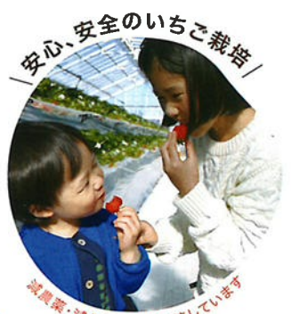
／ 安心、安全のいちご栽培 ／