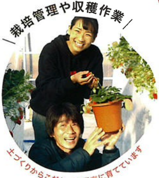
／ 栽培管理や収穫作業 ／