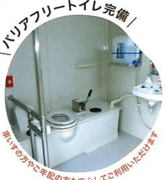
／ バリアフリートイレ完備 ／