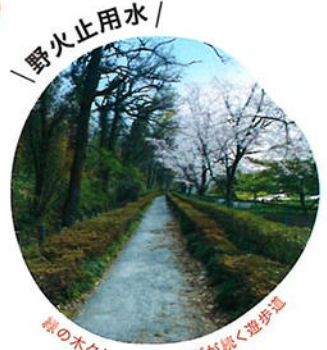
／ 野火止用水 ／