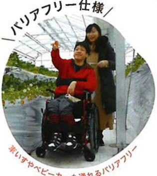
／ バリアフリー仕様 ／