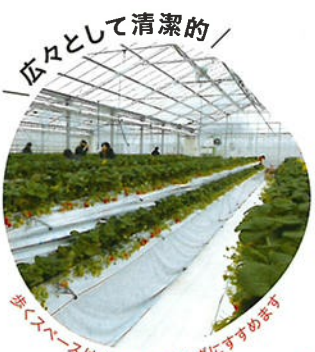
／ 広々として清潔的 ／