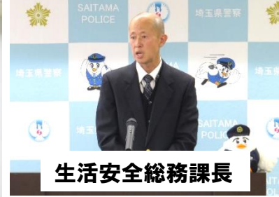
生活安全総務課長